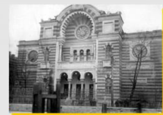
Рис. 1. Хоральная синагога, Минск, 1920-е гг. [16]

Еврейская интеллигенция Минска в начале XX в. решила открыть синагогу, подобную синагогам городов Европы. Синагога была построена в 1906 г. по инициативе врача Иосифа Лунца на средства, собранные евреями города. После перестроек здание приняло современный вид. Сохранились лишь отдельные фрагменты прежнего фасада. очевидцы вспоминали: «Это было великолепно отделанное здание. Большой зал мог вместить до 400 человек. Там же находилась библиотека. Эта великолепная синагога стала предметом гордости евреев города» [15, с.23].