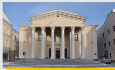
Рис. 2. Национальный драматический театр имени М.Горького, Минск, 2000-е гг. [13]

В 1922 г. группа представителей минской областной комиссии по изъятию церковных ценностей обсудила будущее городских синагог. В главной Хоральной синагоге подверглись ревизии ценные серебряные светильники, кубки и др. С гордостью члены Евсекции подчеркивали: «Величайшей победой в текущей борьбе с клерикализмом стало занятие Хоральной синагоги. Оно придало ускорение процессу экспроприации синагог в других местах». Культовые здания стали использовать в политических целях [1, с.152].