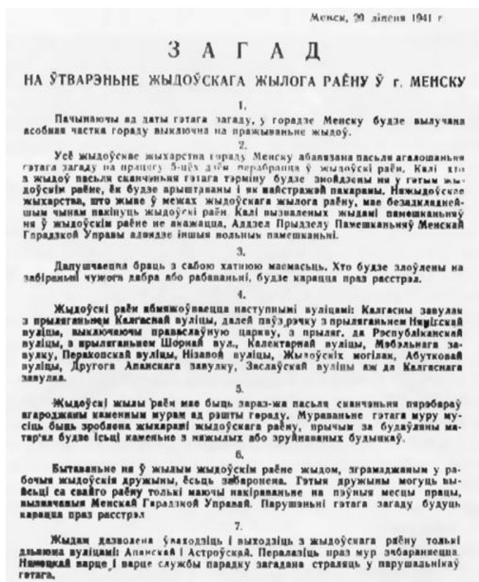
Ил. 1. Приказ о создании Минского гетто. 20 июля 1941 г. [VIII]

В первые дни оккупации был проведен учет городского населения, который