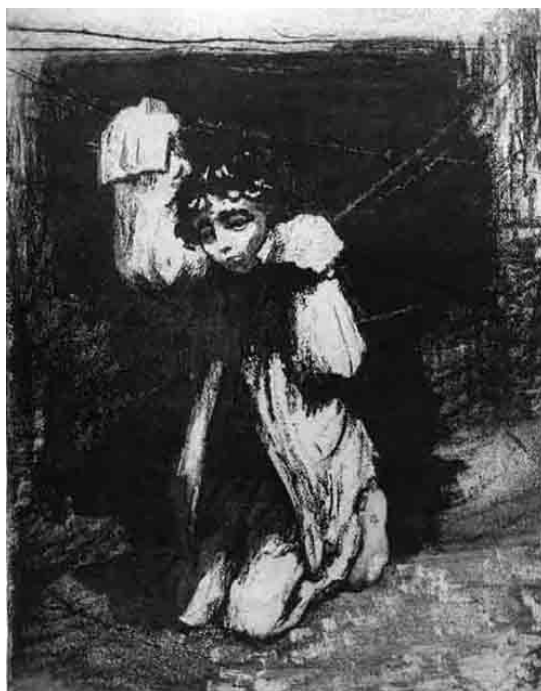
Ил. 9. Лазарь Ран. За колючей проволокой. Из серии «Минское гетто». Офорт. 1962–1972 гг.