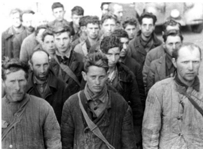
Ил. 5. Еврейские рабочие из гетто на принудительных работах. Минск, 1942 [IV]

«...перевозить песок и глину с одного места на другое и обратно, копать землю без лопат ... разборка разрушенных зданий, чистка железнодорожных путей, рытье ям, окопов, вырывали ямы и засыпали их снова...» [26, с.196–197].