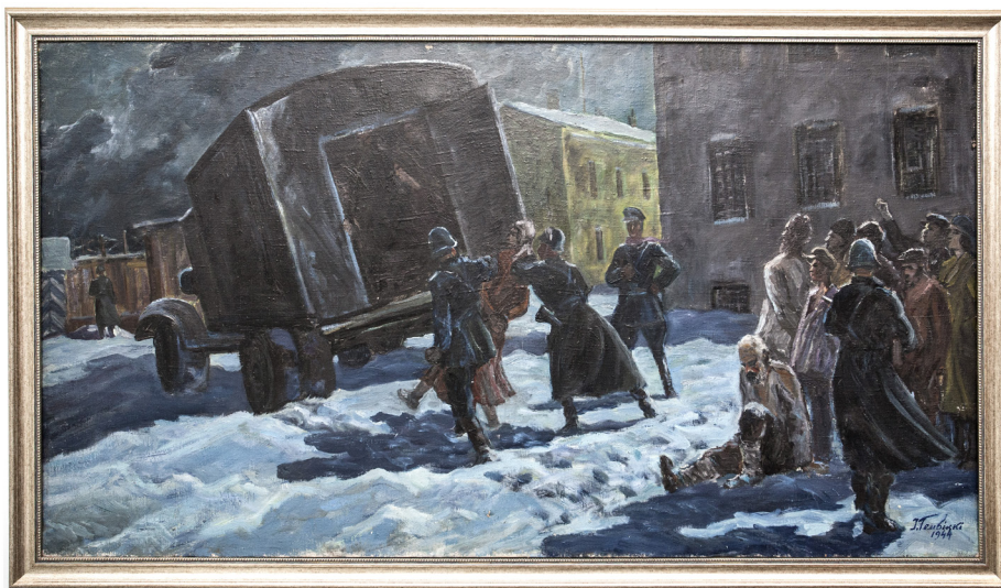
Ил. 8. На картине И. Гембицкого 1944 г. изображен момент посадки жертв в автомобили-«душегубки». [11]

По количеству уничтоженных евреев самыми страшными были заранее спланированные нацистами погромы, которые имели целью ликвидировать как можно больше лиц еврейской национальности. Возглавляли их и