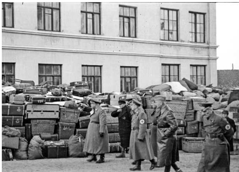
Ил. 7. Багаж депортированных евреев на территории «зондергетто». [1]

В сентябре 1941 г. началась депортация евреев из Германии. Санкция на такой официальный шаг была дана самим Адольфом Гитлером. С 1 ноября 1941 г. по 4 декабря 1942 г. планировалось переселить 50 тыс. евреев из Рейха, восточных и пограничных областей, протектората Богемия и Моравия в районы Риги и Минска [16, с.249-250]. Предусматривалось доставить 25 тыс. граждан еврейской национальности непосредственно в Минск [13, с. 44]. Так первый транспорт из Гамбурга («гамбургские евреи») выехал 8 ноября и прибыл в Минск 11 ноября 1941 г.