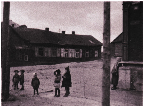
Ил. 4. Дети у проволоки гетто [III]

Однако еврейскому комитету удалось организовать для сирот детский дом на ул. Заславской возле границы гетто [4, с.57]. В отчете городского комиссара за октябрь – ноябрь 1942 г. имеются данные о том, что в гетто на тот момент насчитывалось 2 127 детей [18, л.21].