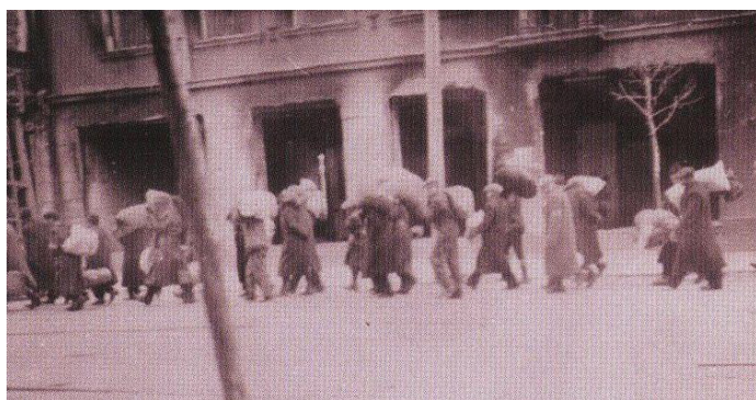
Ил. 3. Переселение в Минское гетто. 1941 г. [VII]

Таким образом, евреям, которые переехали в гетто с нажитым имуществом, категорически запрещалось далее находиться за пределами Минского гетто. Они могли включаться в созданные немцами рабочие колонны и покидать еврейский жилой район только со специальным направлением к месту работы, которое выдавалось Минской городской управой. За нарушение данного распоряжения предусматривался расстрел.